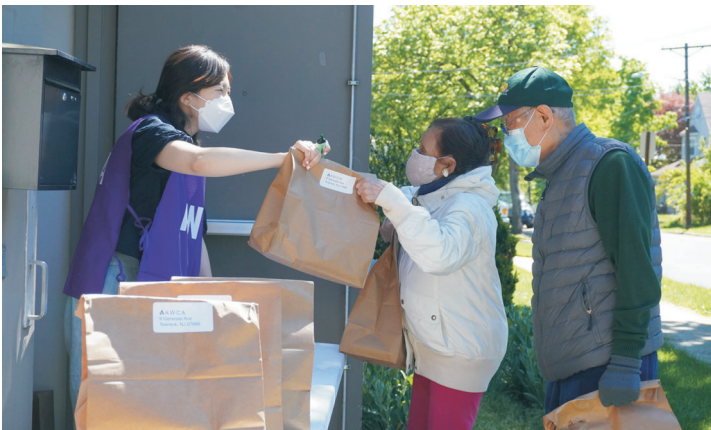
사랑의 프리런치 전달