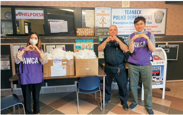
파월스 데이 - 티넥경찰서에 런치 전달