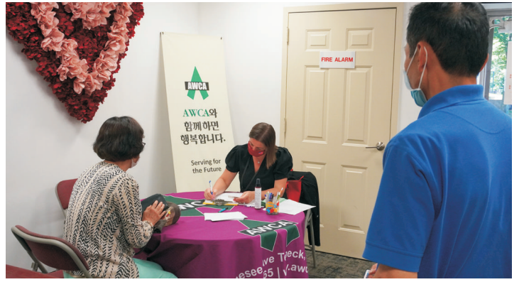
버겐카운티 파머스마켓 쿠폰데이