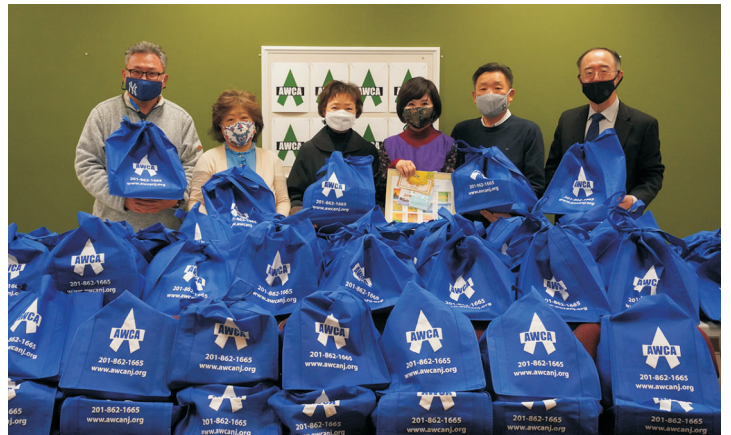
싱글맘 가정에 사랑의 바구니 전달 - 팻팻 한인회와 함께