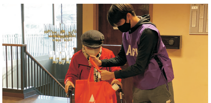
사랑의 음식바구니 - 엔젤바구니 전달