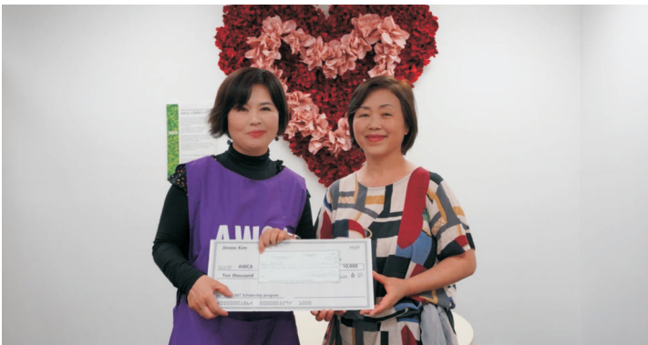
그레이스 체리티 파운데이션 - SAT & ACT 장학 클래스 도네이션