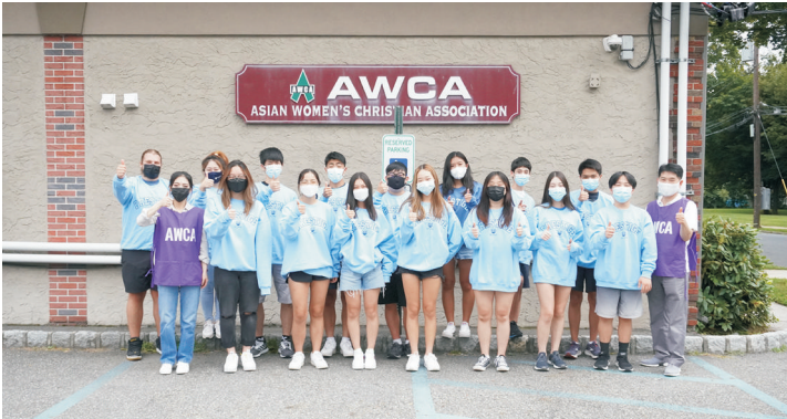
2021 SAT & ACT 장학 클래스 완료