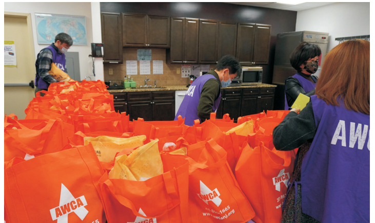
엔젤음식바구니 포장 - AWCA 직원들과