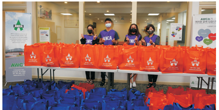
엔젤바구니 음식 포장 - 청소년 봉사자들과