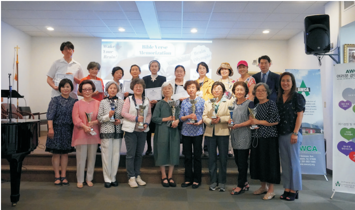
치매예방 - 두뇌올림픽 (성경 암송) 수상자들과