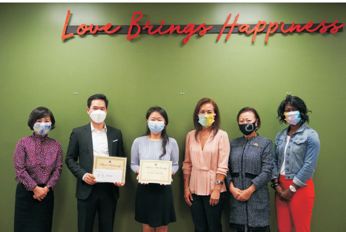
2020 기화장학금 전달식

AWCA는 고 곽기화 선생님의 뜻을 기억하며, 장학사업은 계속 이어갈 것이다.