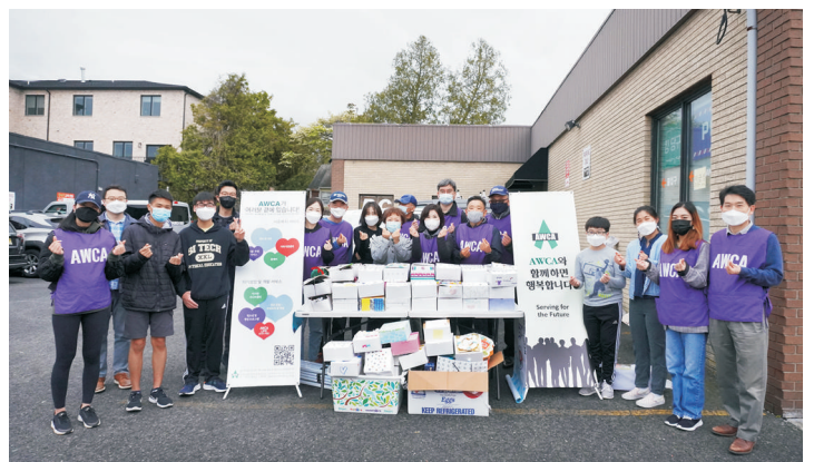
싱글맘 가정돕기 - 팻팻한인회, 참된교회 학생들과 함께