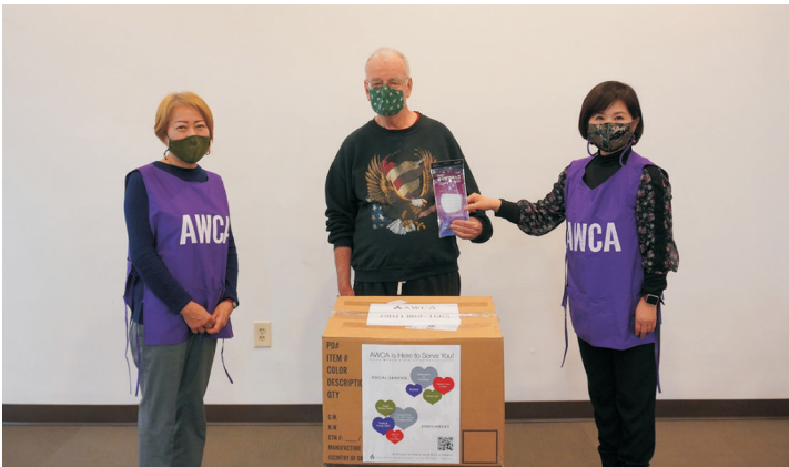
티넥 재향군인회에 마스크 도네이션