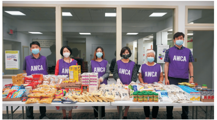
사랑의 음식바구니 - 엔젤바구니 준비