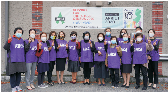
2020 센서스 종료식 - 봉사자들과