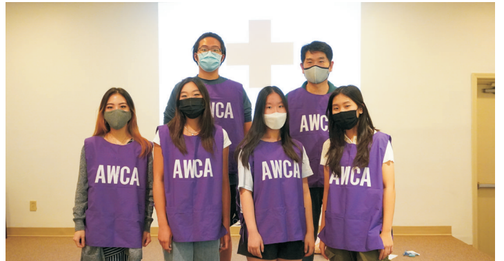
청소년 리더십 클래스 수료자들과