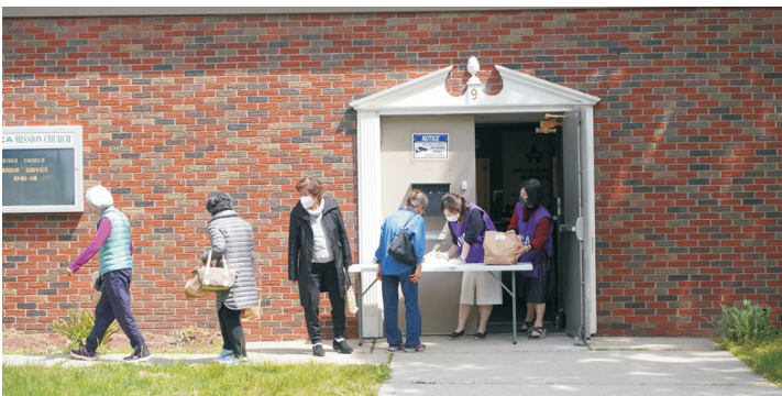
홀리네임 병원 - 사랑의 프리런치 전달