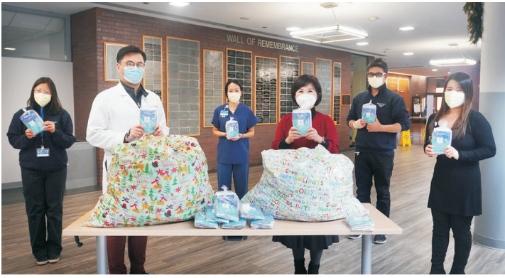
잉글우드 병원에 마스크, 손세정제 도네이션