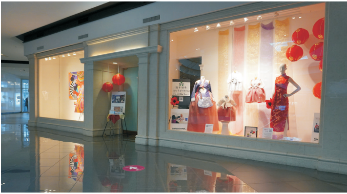
음력설 전시관 마련 - 리버사이드 몰