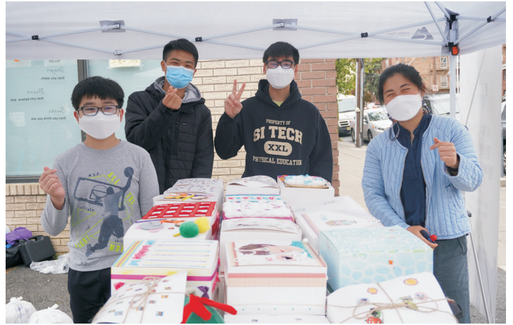
엔젤바구니 - 참된교회 Youth Group