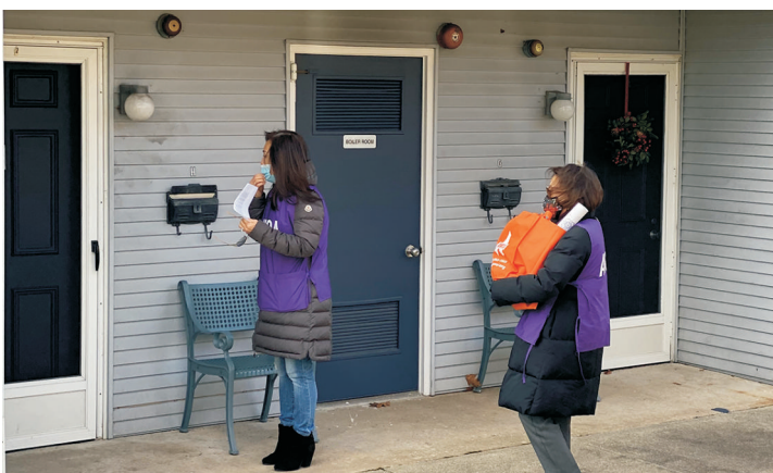
사랑의 음식바구니 - 엔젤바구니 전달 AWCA 이사진