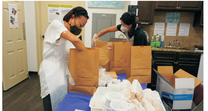
런치 박스 준비