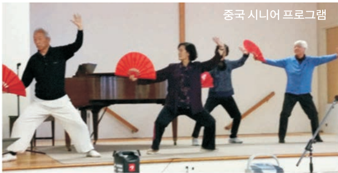
중국 시니어 프로그램