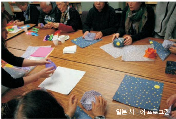
일본 시니어 프로그램