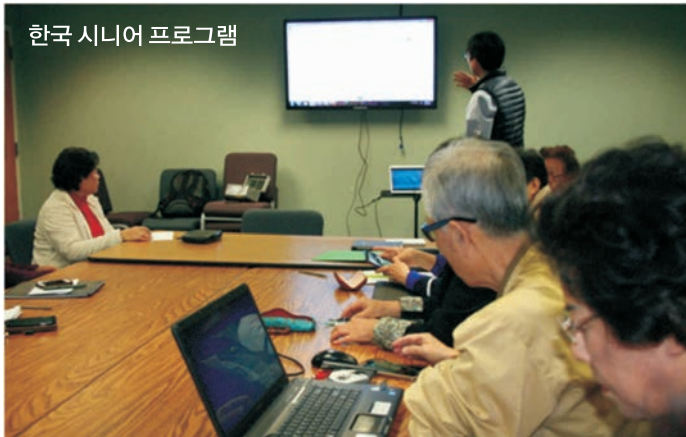
한국 시니어 프로그램